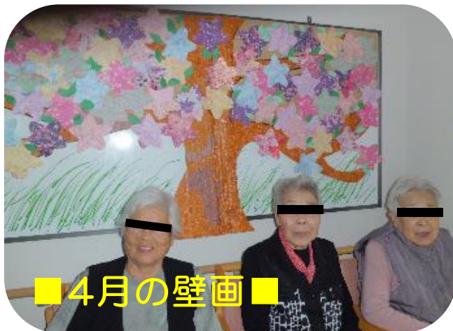
■ 4月の壁画 ■

和では毎年恒例の花見ドライブでしたが、今年の桜は開花も遅く、雨続きで外出できませんでした。皆様に一つ一つ丁寧に貼っていた桜の壁画を眺めて楽しんでいただきました。