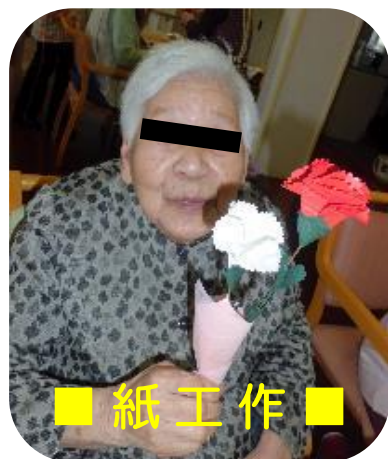
■ 紙工作 ■

皆様に好評で、「足の痛みがとれたような気がする。」「とても気持ちよかった。」とうれしいお言葉を頂くことも多く、次の来所を楽しみにされる方が増えました。